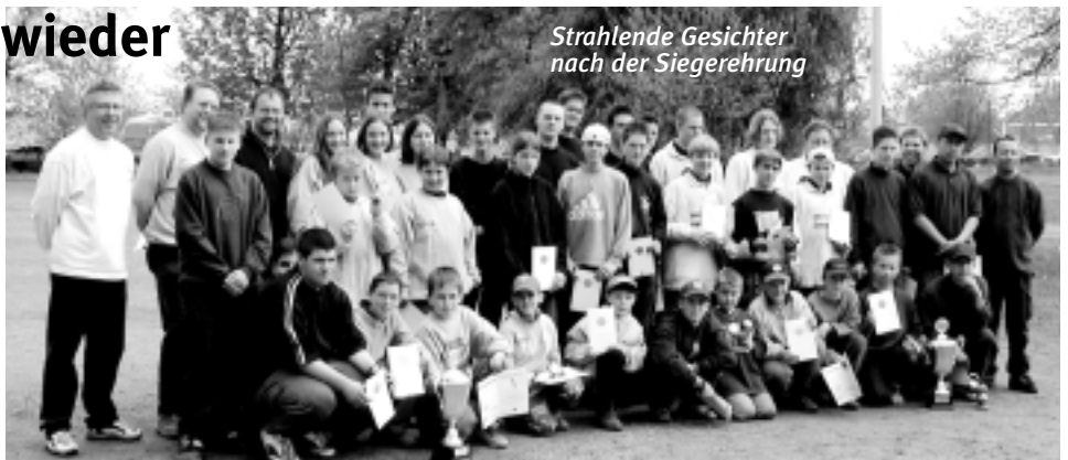
Strahlende Gesichter nach der Siegerehrung

Leider hatten nur Baden-Württemberg, Nordrhein-Westfalen und Rheinland Pfalz zwei komplette