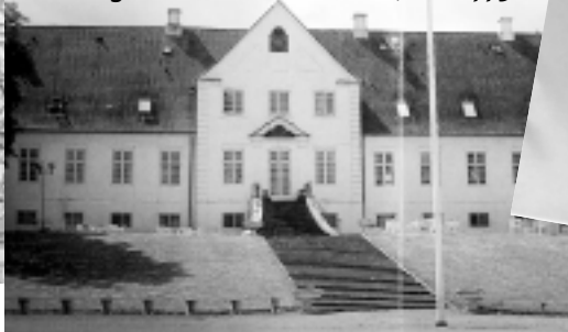
Das Scandic Hotel Borgholm Park in Horsens

Der Eingang zum Restaurant, dem ehemaligen Herrenhaus aus dem Jahre 1775